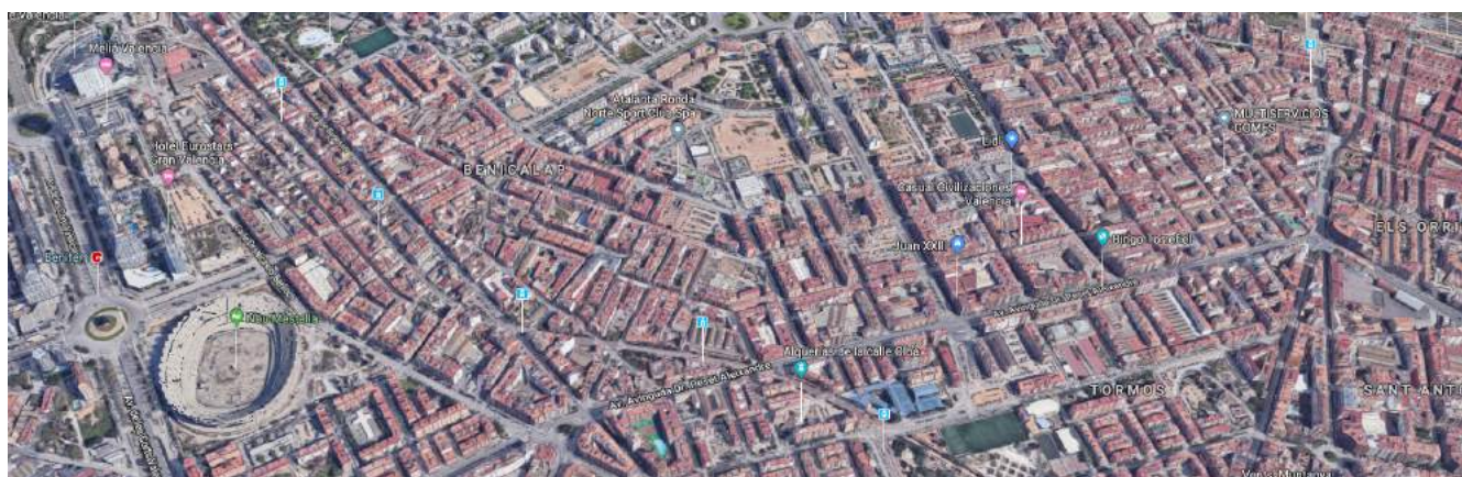
Imatge Google 2019

1.2.3 L'escenari de l'obra són el barri de Benicalap i un altre que no s'esmenta. Busca informació sobre Benicalap. Fes servir l'eina de Google Street View per desplaçar-te pels carrers del barri.